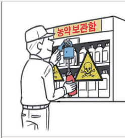
농약 보관함의 독극물 경고 표지