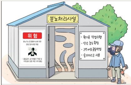
양돈 분뇨 처리장의 질식 재해 경고 표지