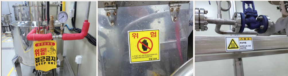
가공사업장의 각종 금지 및 경고 표지