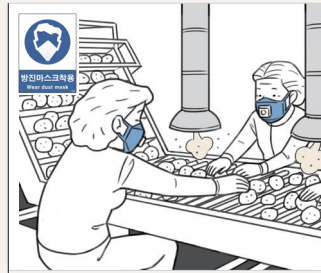
실내 감자 선별장의 방진 마스크 착용 지시 표지